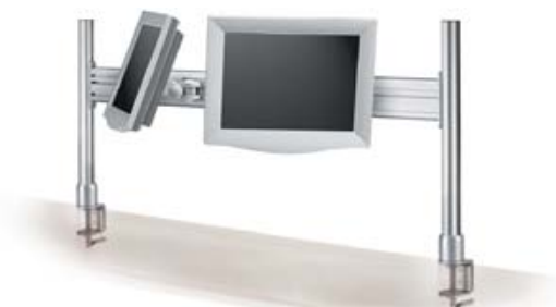
438-PA01 Monitor- & Toolbar , 1000 mm 438-PAX6 Monitor- & Toolbar , 1600 mm Den populära standardmodellen för arbetsplatser med krav på flexibilitet och elegans. Inkl. bordsfäste.

Kan monteras sektionvis i 90° och 180° vinkel samt kundanpassade längder på vägghpanel.