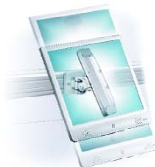
438-60T6 Monitorslider, max 3-5 kg, vertikal slaglängd 170 mm. 438-60T8 Monitorslider, max 5-7 kg, vertikal slaglängd 170 mm. Observera att Monitorslider är ett tillbehör till LA682/683.

Monitorslider – justera monitorn i höjdlid för bästa ergonomi.