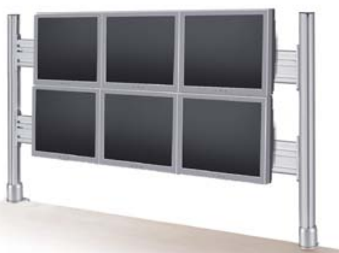
438-PA02 Monitor- & Toolbar TWIN , 1000 mm 438-PAD6 Monitor- & Toolbar TWIN , 1600 mm Dubbel skena, inkl bordsfäste, för den kräsne användaren inom exempelvis övervakning.