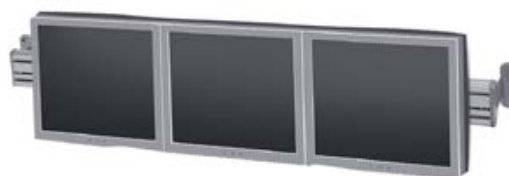
438-PA03 Monitor- & Toolbar , 1000 mm 438-PAV6 Monitor- & Toolbar , 1600 mm Skena för väggmontage på kontor- / butik- / utställning- eller show-room. Kan monteras vertikalt för förhöjd visuell effekt. Inkl. väggfäste.