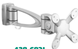
438-682L Monitorfäste modell LA682, längd 340 mm.