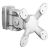
438-683L Monitorfäste modell LA683, längd 140 mm.

Kraftiga monitorfästen för bästa funktion. Observera att monitorfästena även passar andra fabrikat för dig som redan har en skena. Kontakta oss för information.